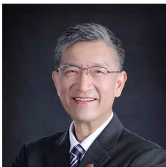
励建安 美国医学科学院 国际院士