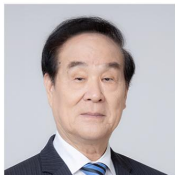
刘庭芳 国际医疗质量与安全 科学院终身院士